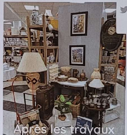
Après les travaux